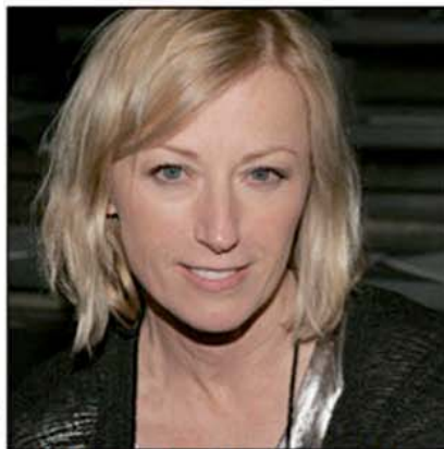
Cindy Morris Sherman, 1954 in der Nähe von New York geboren, ist mit ihren kunstvoll verarbeiteten Selbstporträts weltberühmt geworden.

DIE ZEIT : Frau Sherman, es hat lange gedauert, Sie für ein Interview zu gewinnen. Ihr Galerist sagte mir, Sie seien sehr schüchtern und würden grundsätzlich nicht gerne Auskunft über Ihre Arbeit geben, stimmt das?